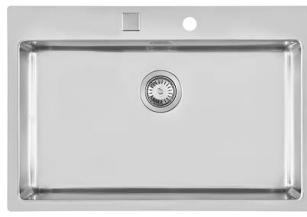
水槽 KE Filotop